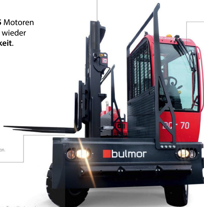
DQn: niedrige Plattform für optimale Raumnutzung

mit Komfortfunktionen in der Premium Line: • Motormeldungen • Verbrauchsanzeigen • Statusüberwachung uvm.