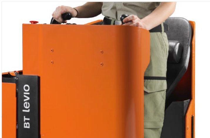
Der Fahrer ist im Fahrerstand rundum geschützt