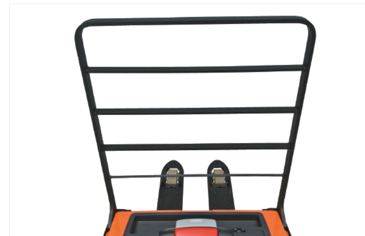
LWE mit Lastschutzgitter