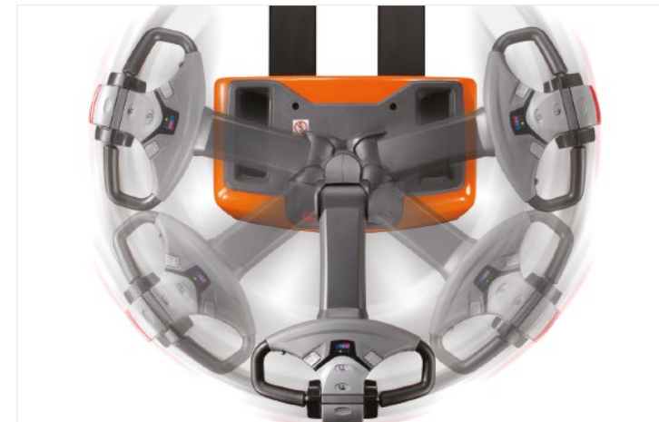
Rotation der Deichsel