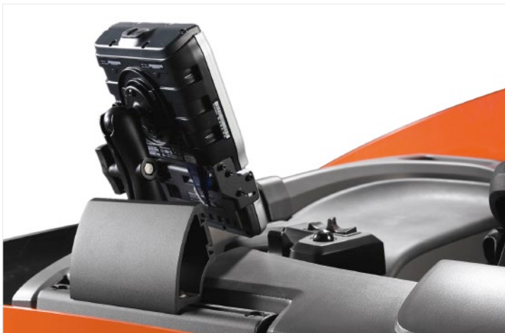
Optionaler E-Bar für Zubehör