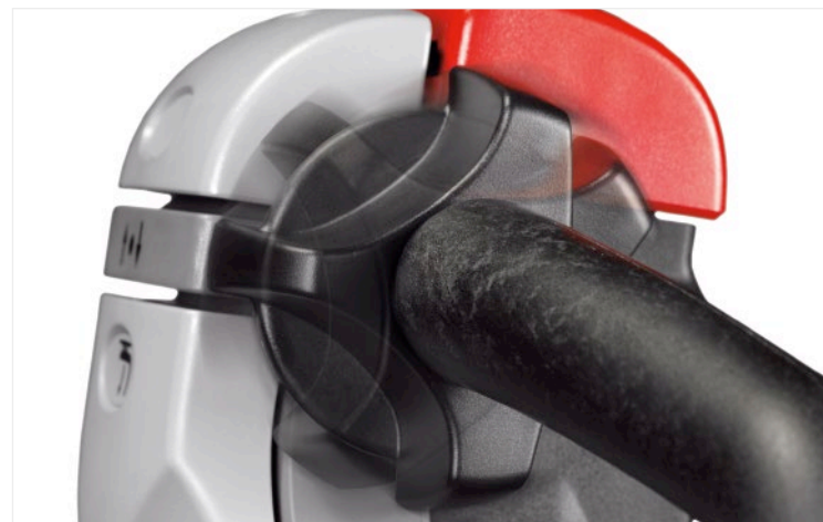
Fahren, Heben und Senken mit einem Fingertipp mit der einzigartigen Rangierfunktion „Click-2-Creep“