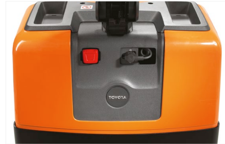
Bedienkonsole mit ausziehbarem Netzkabel für das integrierte Batterieladegerät