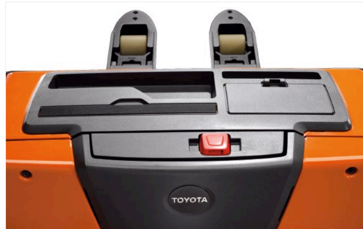
Freie Sicht auf die Gabel