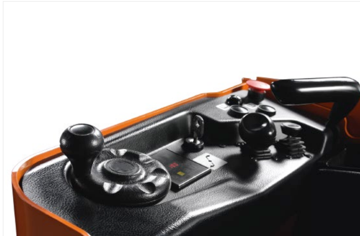
Einfache Steuerung durch kleines elektronisches Lenkrad