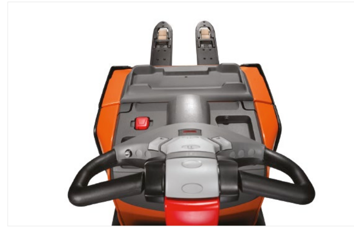
Freie Sicht auf die Gabel aus der Fahrposition