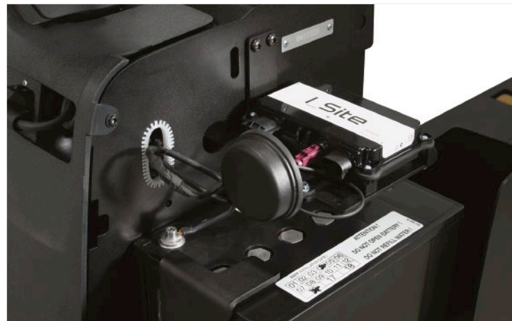
Einfacher Zugang für effizienten Service