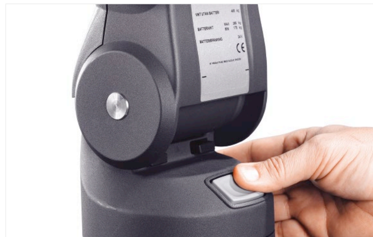
Die Deichsel ist auf Knopfdruck höhenverstellbar