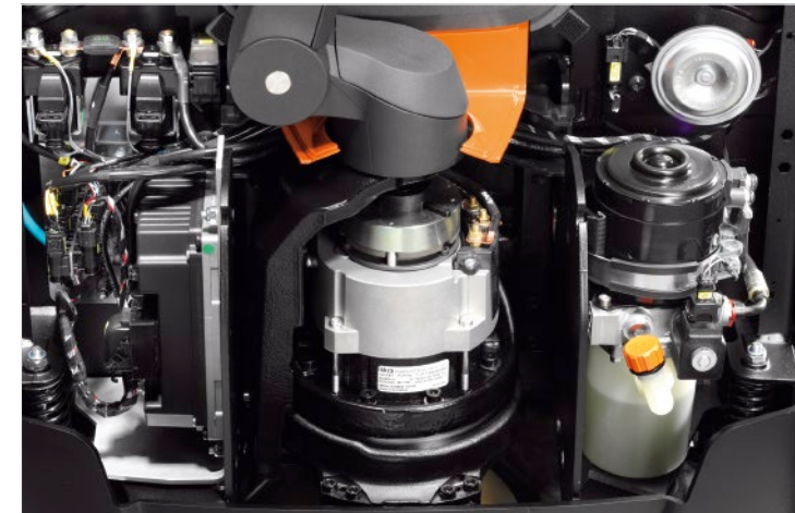
Einfacher Zugang für effizienten Service