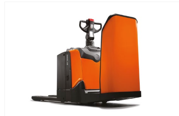
Feste Plattform mit Rückenlehne