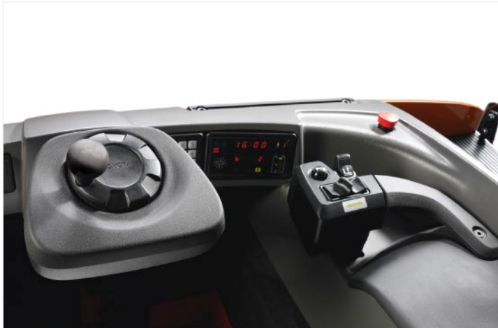
Die Bedienelemente sind individuell einstellbar