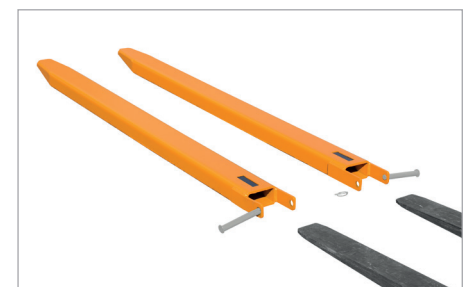
Sicherung durch Steckbolzen

Andere Abmessungen auf Anfrage lieferbar